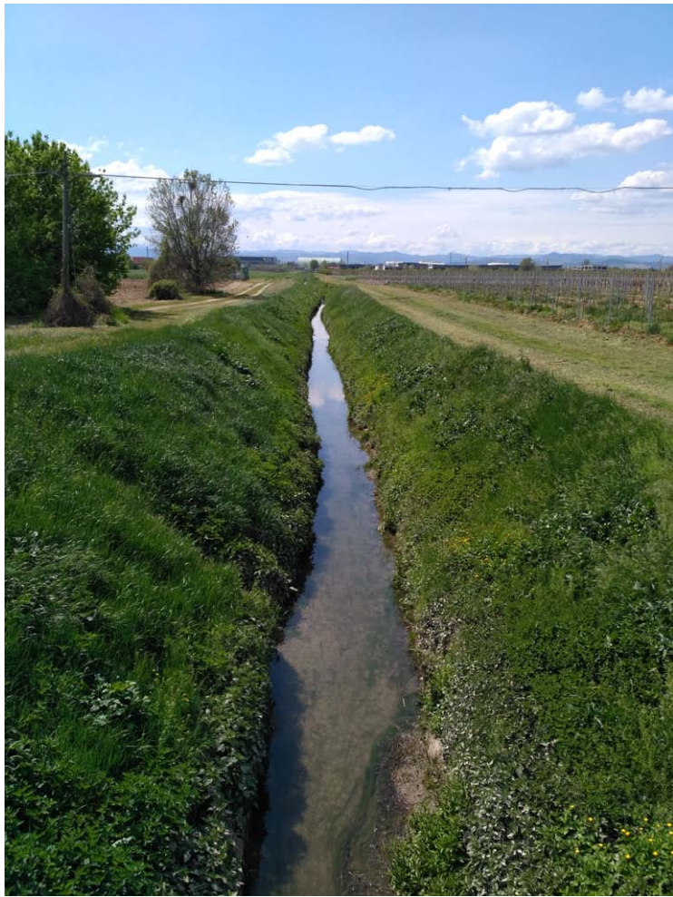
13_Vista verso sud Fosso Vecchio