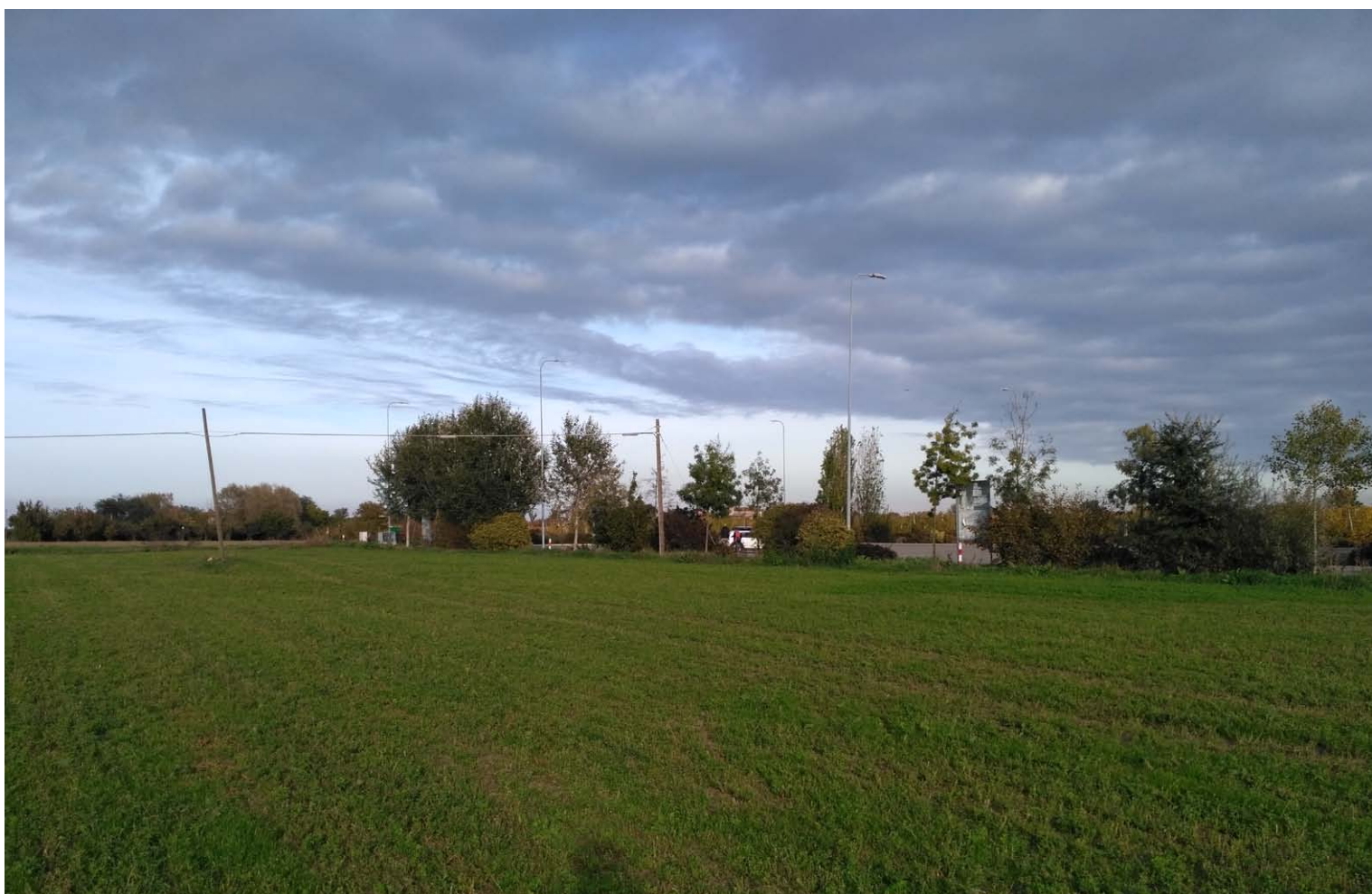
6_Vista verso nord-est