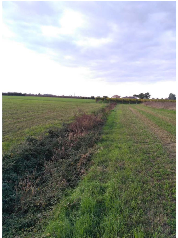
10_Vista verso ovest