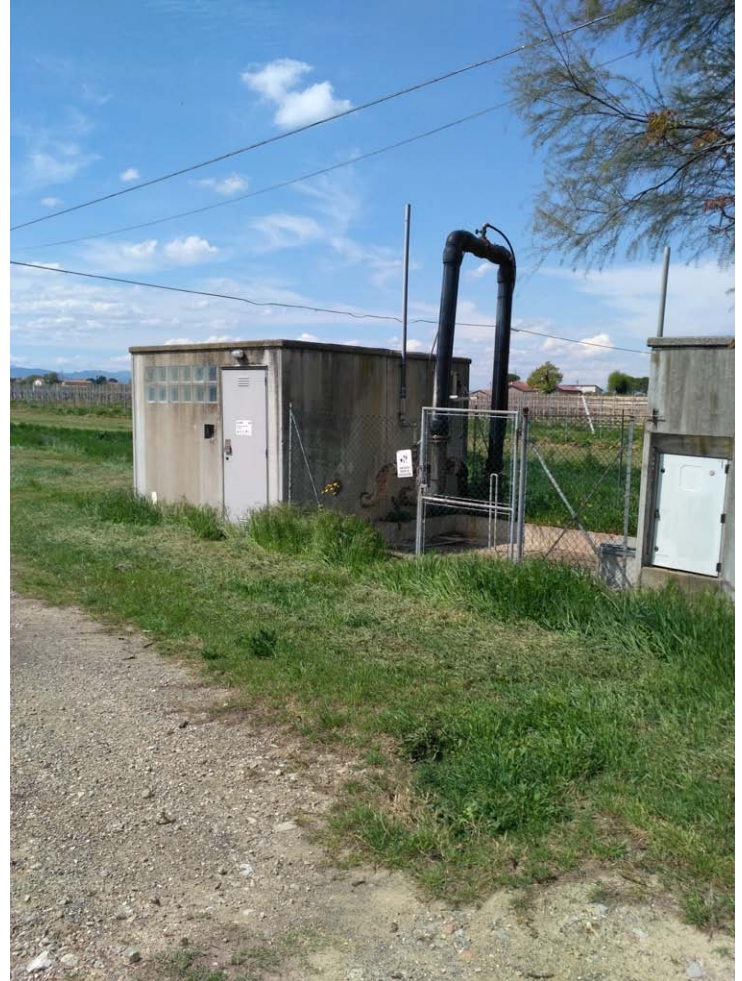
12_Stazione di rilancio fognatura al depuratore