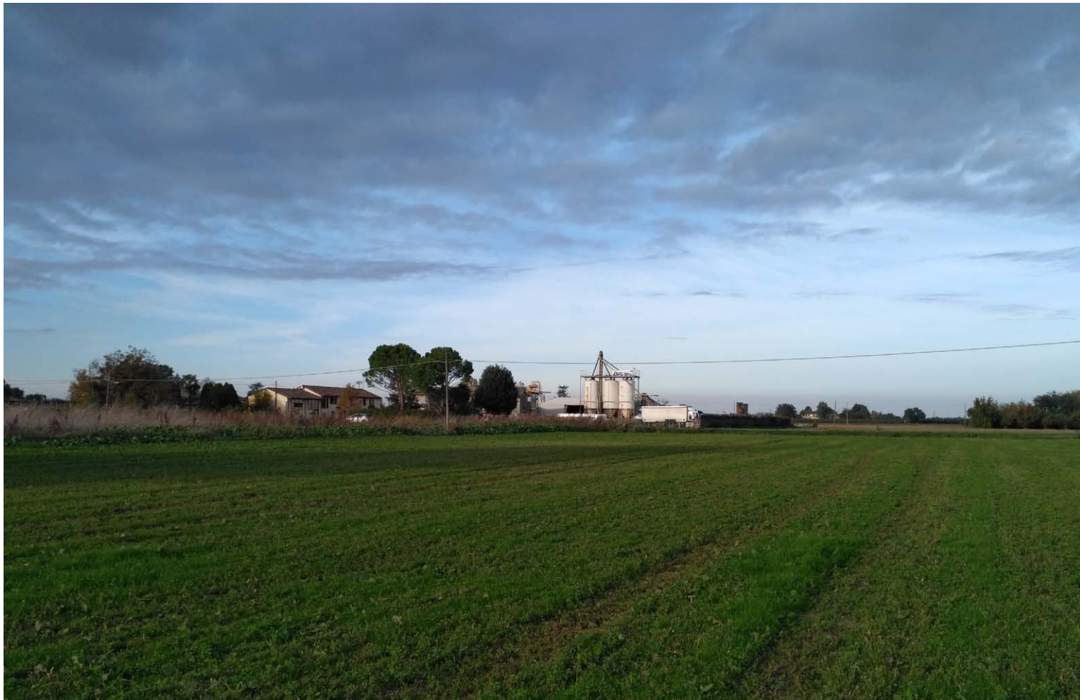
5_Vista verso nord