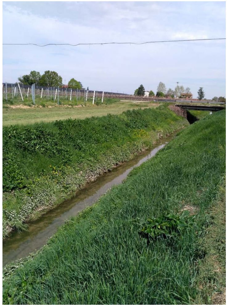
14_Vista verso nord Fosso Vecchio