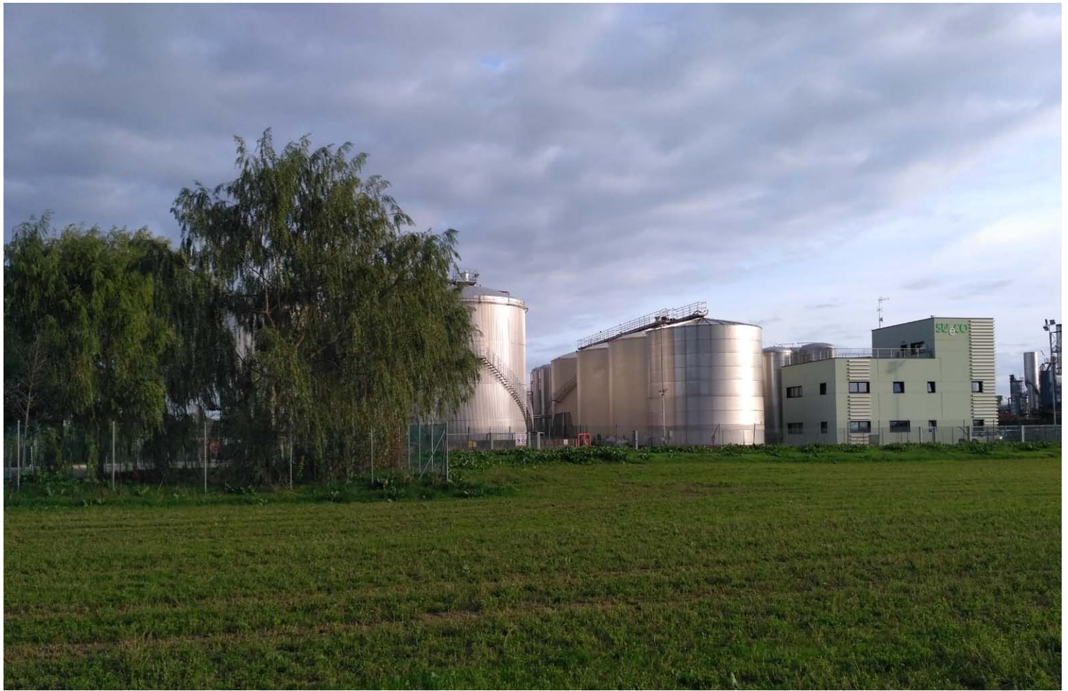
1_Vista verso est_stabilimenti SUECO