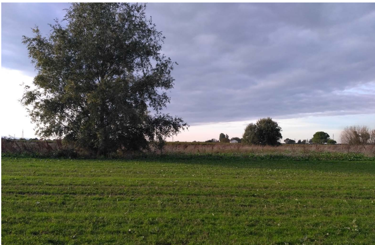
4_Vista verso ovest