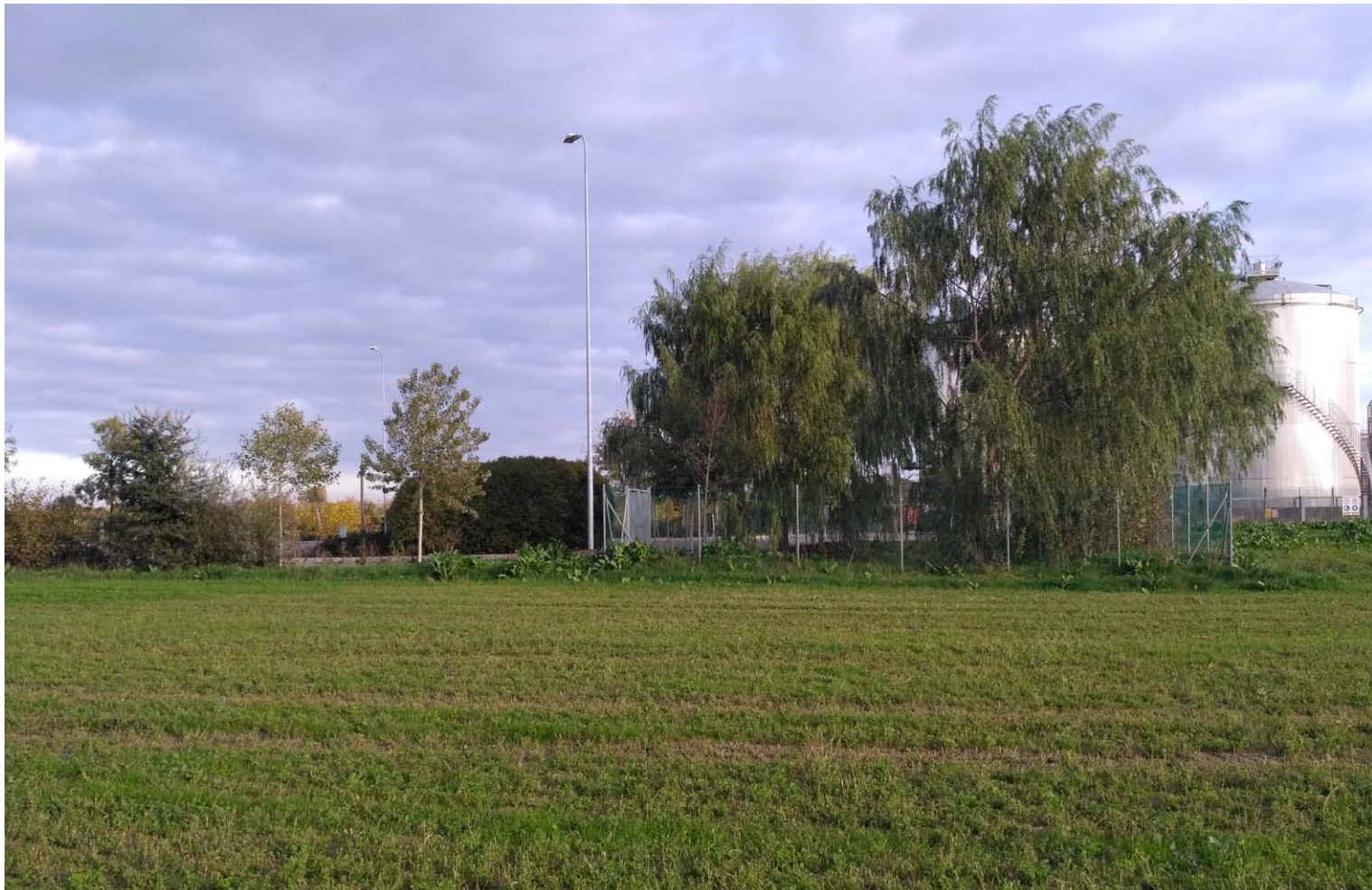
7_Vista verso est - parcheggio pubblico