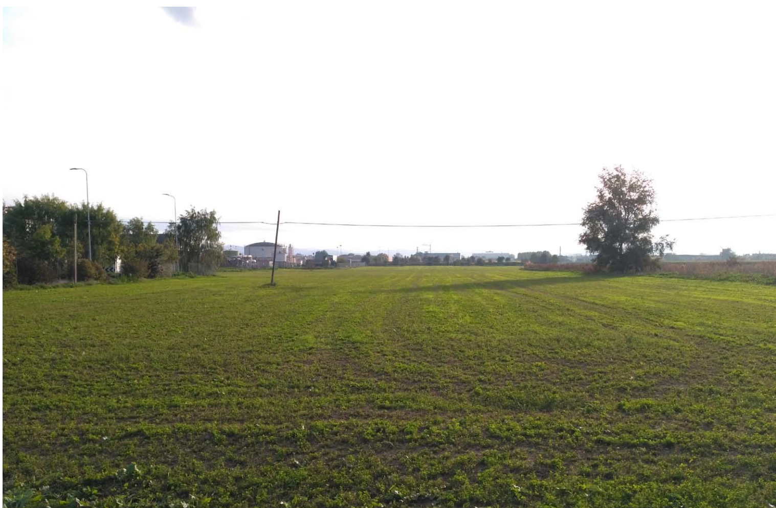
8_Vista verso sud