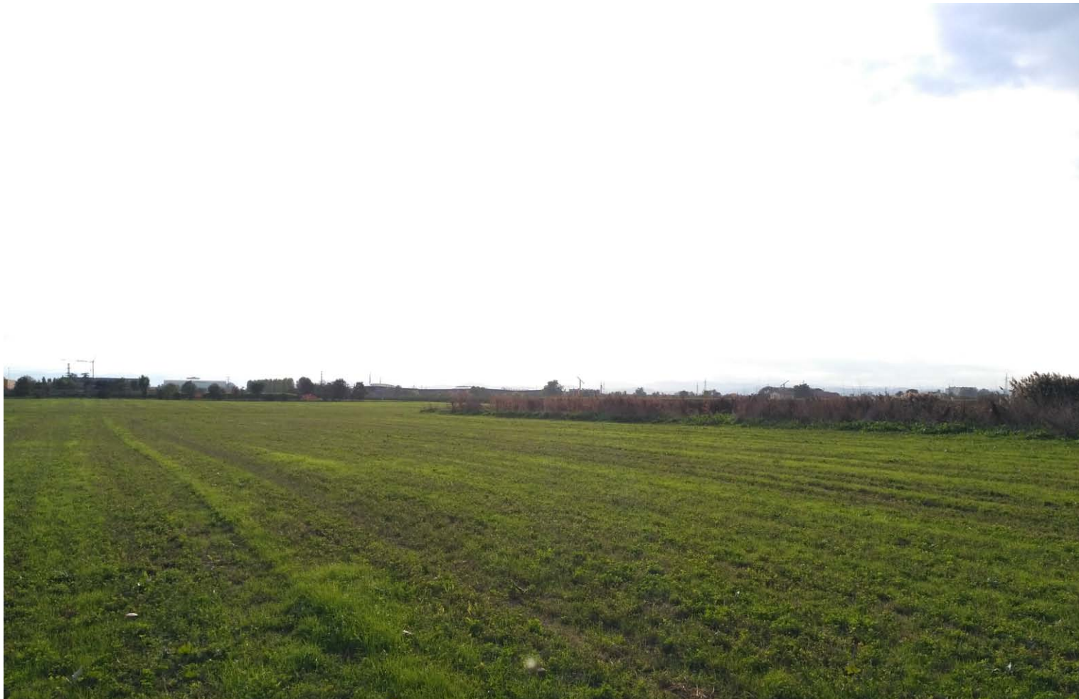
3_Vista verso sud-ovest