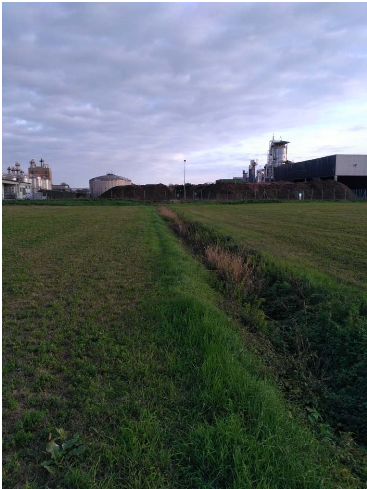
9_Vista verso est