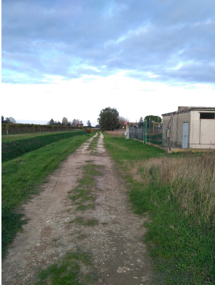
11_Carraia e cabina metanodotto_vista verso nord