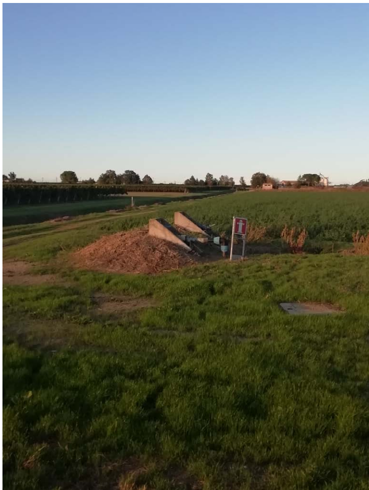
15_Vista verso nord