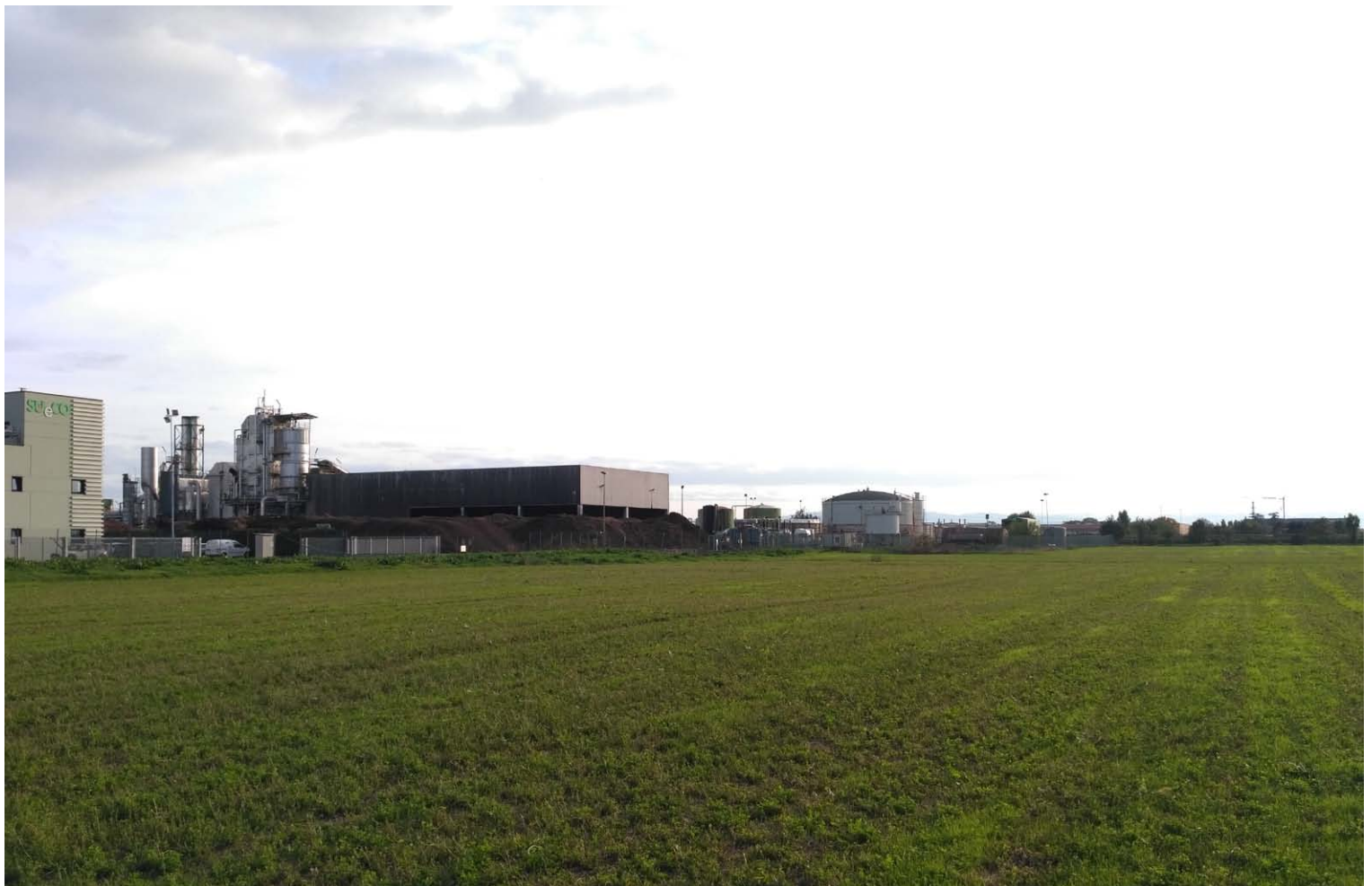
2_Vista verso sud-est